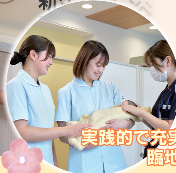
新生児室での 母性看護学実習