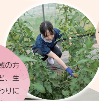
成人看護学実習 I期