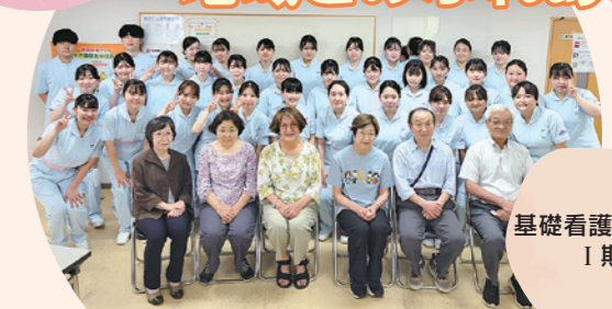
基礎看護学実習 I期