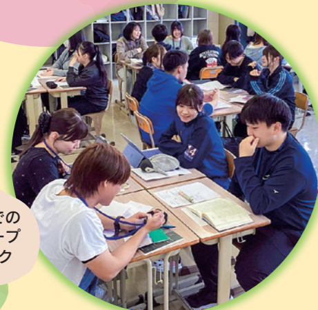
教室での グループ ワーク